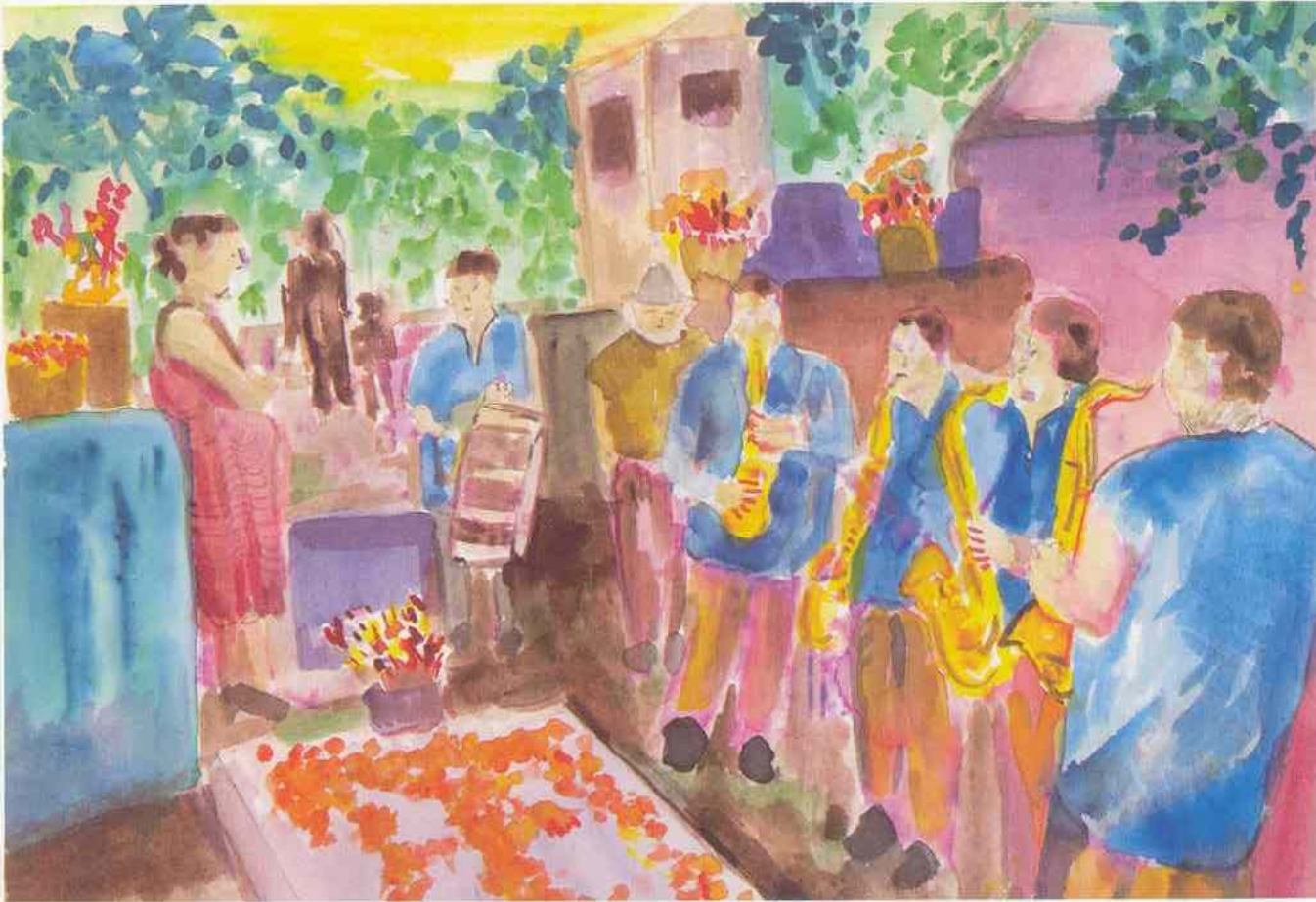
Bi musk lu ba/ Banda en panteón