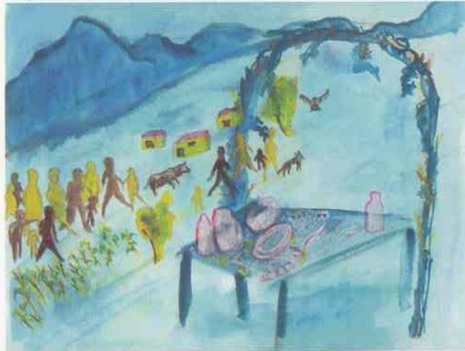
Tlahuitoltepec, Lu'a, Yëdz Mixh