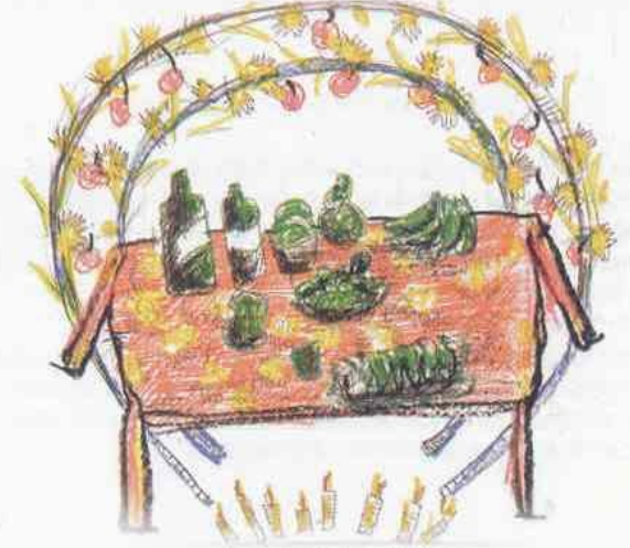
San Juan Tabaa, Lu'a.