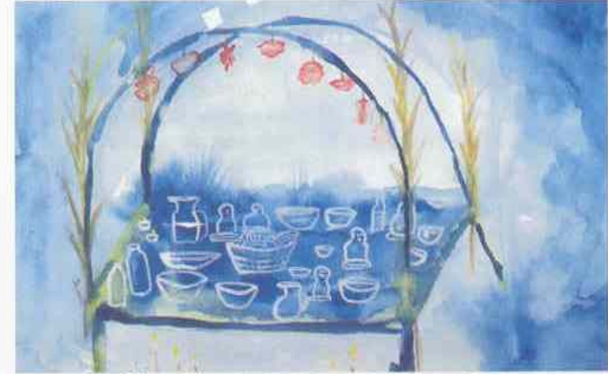
San Miguel, Ilhowi kie yëdz ga Rxhití Nis, Chiapas.