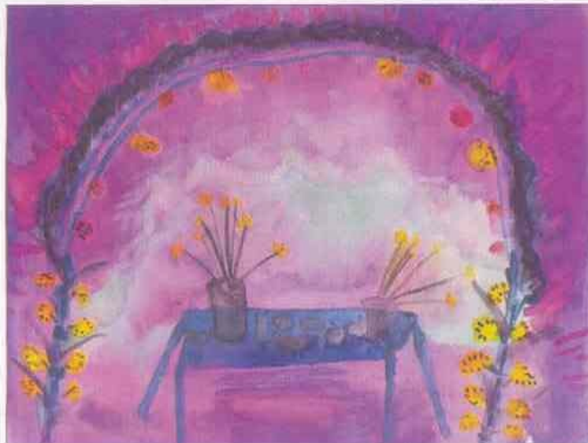
Tamazulapan Ihen Miahuatlàn, Lu'a