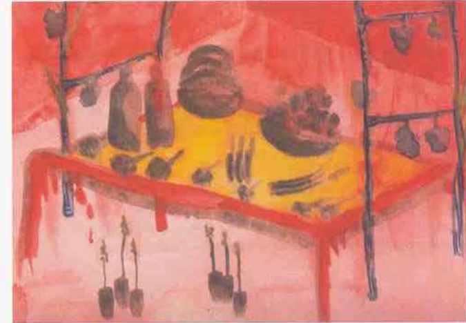
Tlahuitoltepec, Lu'a, Yëdz Mixh